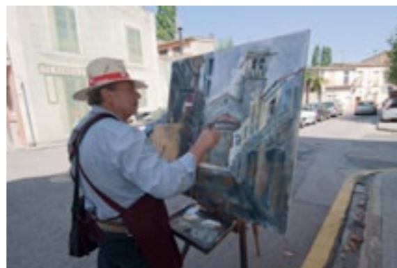
Un dels pintors a la Rambla d'en Rufi