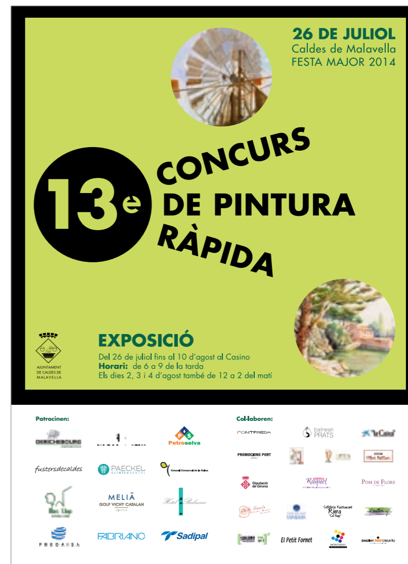
Cartell de la 13a edició