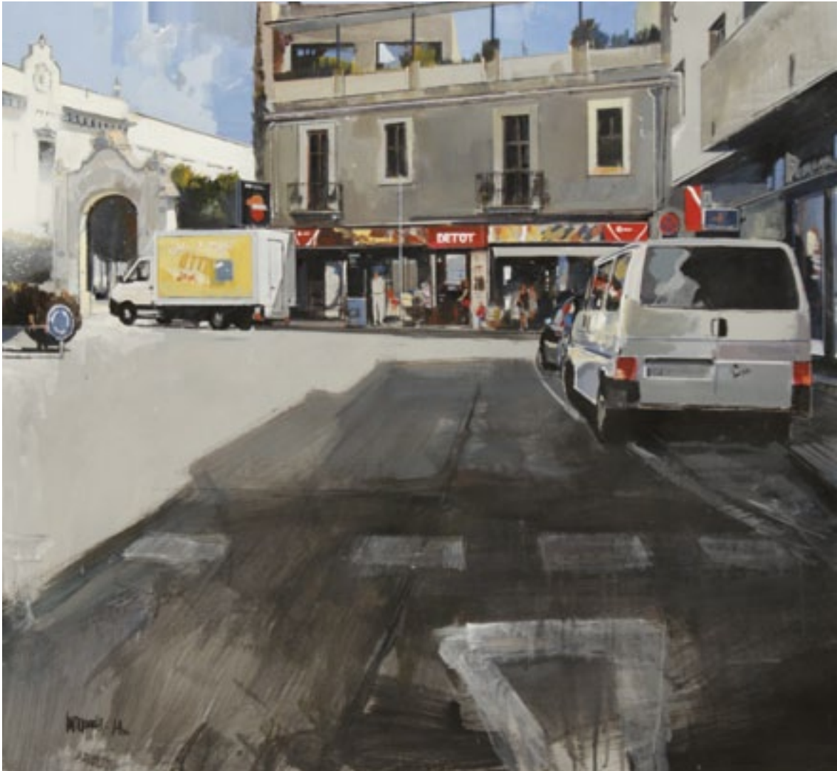
Lluís Puigrós i Puigdel·lívol, 1r premi de Tècnica Lliure 2014 (Ajuntament de Caldes de Malavella)