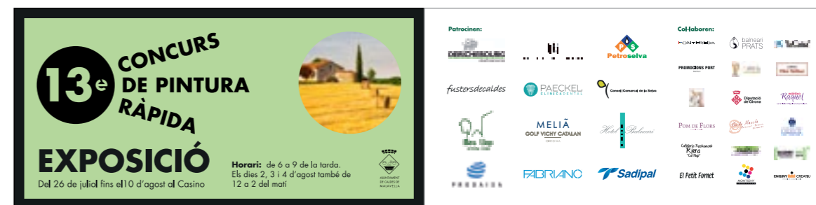
Fulletó de la 13a edició