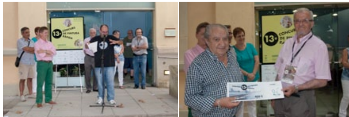
Entregues dels premis de l'edició 2014